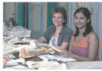
Encadrement d'une étudiante en Master Erasmus Mundus (année 2013)