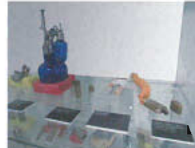
Divers briquets du XX e siècle