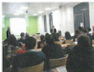
Séminaire «la chasse à travers les âges», au Cépam-CNRS, Nice, février 2014