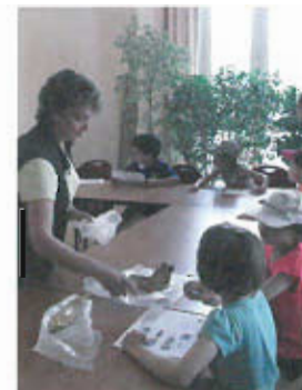
Au Centre de Loisirs (CAL ste Marguerite, Nice), animations sur le thème du «Loup»

La SEPP est agréée par l'Académie de Nice pour l'enseignement et la formation, aux élèves et aux enseignants. Tout au long de l'année, se poursuivent également les encadrements d'étudiants, les fouilles et travaux de terrain, la recherche scientifique, colloques, séminaires et publications scientifiques de rang international.