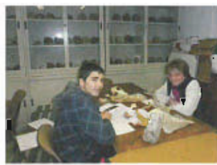
Atelier de paléontologie (stage d'entreprise, élève de 3ème)