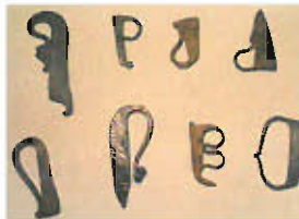
Briquet à silex en métal