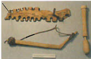
Allumage par friction du bois : planchette, arc et foret