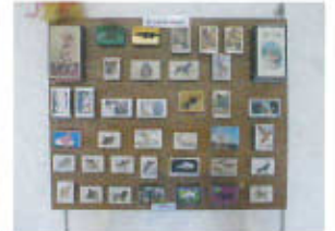
Collection de boîtes d'allumettes (Don Jacqueline Speidel)