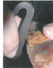
Production du feu par percussion d'un briquet acier sur un silex