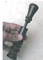
Briquet pneumatique asiatique en bois

Collection privée : Bertrand Roussel Panneaux : Ville de Nice